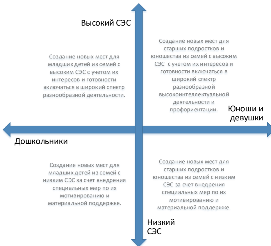
Рис. 5. Шкалы выбора модели создания новых мест по программам художественной направленности с учетом особенностей контингента обучающихся

Вовлечение в программы детей из семей с низким образовательным и культурным уровнем потребует осуществления определенных PR-шагов, поиска мотиваторов для данных детей, в том числе, материальных.