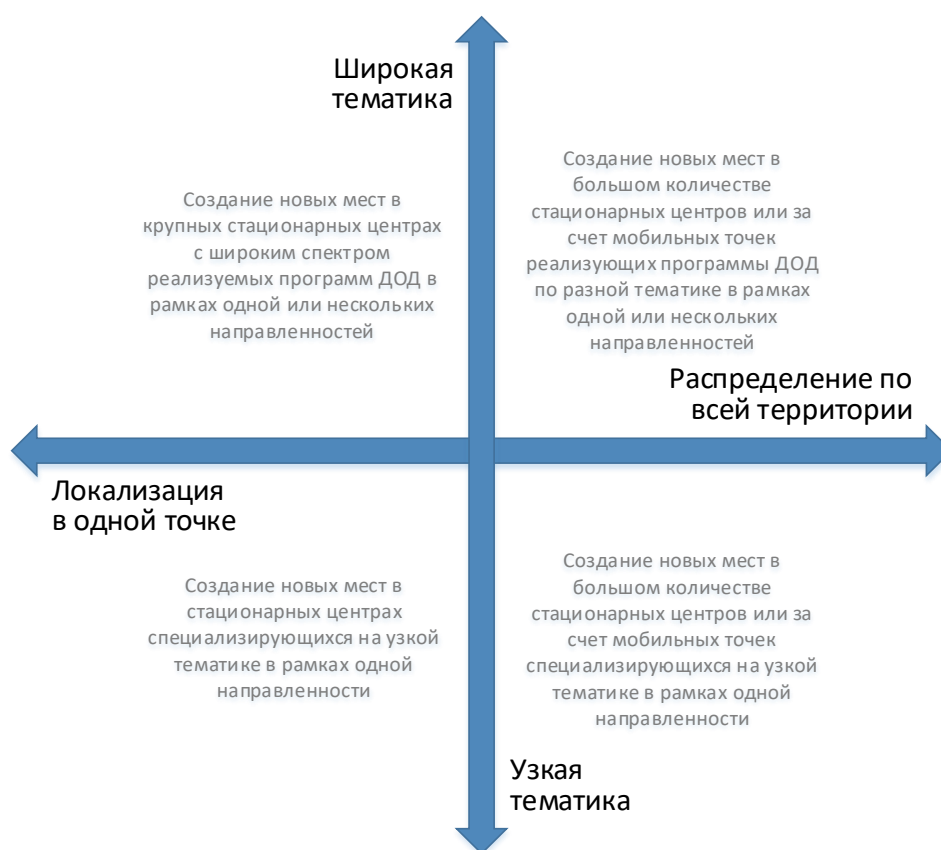
Рис. 3. Шкалы выбора масштаба и формы реализации новых мест по программам ДОД

При невыполнении хотя бы одного из них возникает необходимость пространственного распределения реализуемой модели через мобильные или сетевые решения.