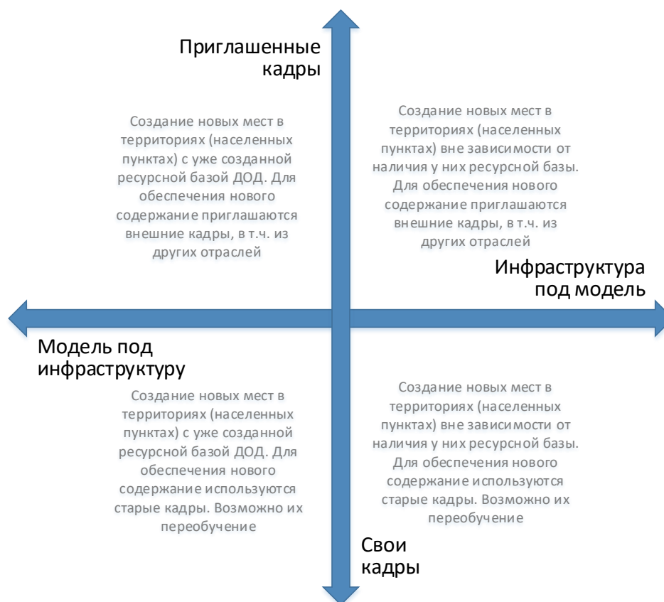
Рис. 6. Шкалы выбора модели инфраструктурного и кадрового обеспечения для типовой модели создания новых мест дополнительного образования

Следует отметить, что механизмы инфраструктурного и кадрового обеспечения не существуют в их полярных вариантах. Решения даже в рамках реализации одной модели будут различны. Анализ перечисленных выше характеристик позволяет сделать эти точечные решения более точными и эффективными.