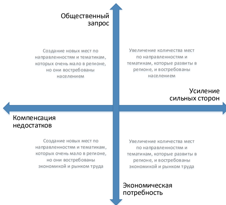
Рис. 2. Шкалы выбора тематики и тактики создания новых мест дополнительного образования