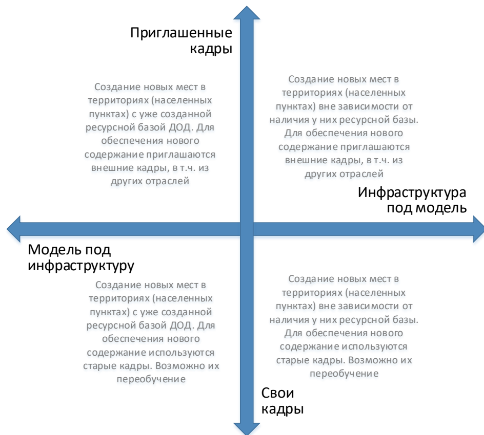
Рис. 6. Шкалы выбора модели инфраструктурного и кадрового обеспечения для типовой модели создания новых мест дополнительного образования

Следует отметить, что механизмы инфраструктурного и кадрового обеспечения не существуют в их полярных вариантах. Решения даже в рамках реализации одной модели будут различны. Анализ перечисленных выше характеристик позволяет сделать эти точечные решения более точными и эффективными.