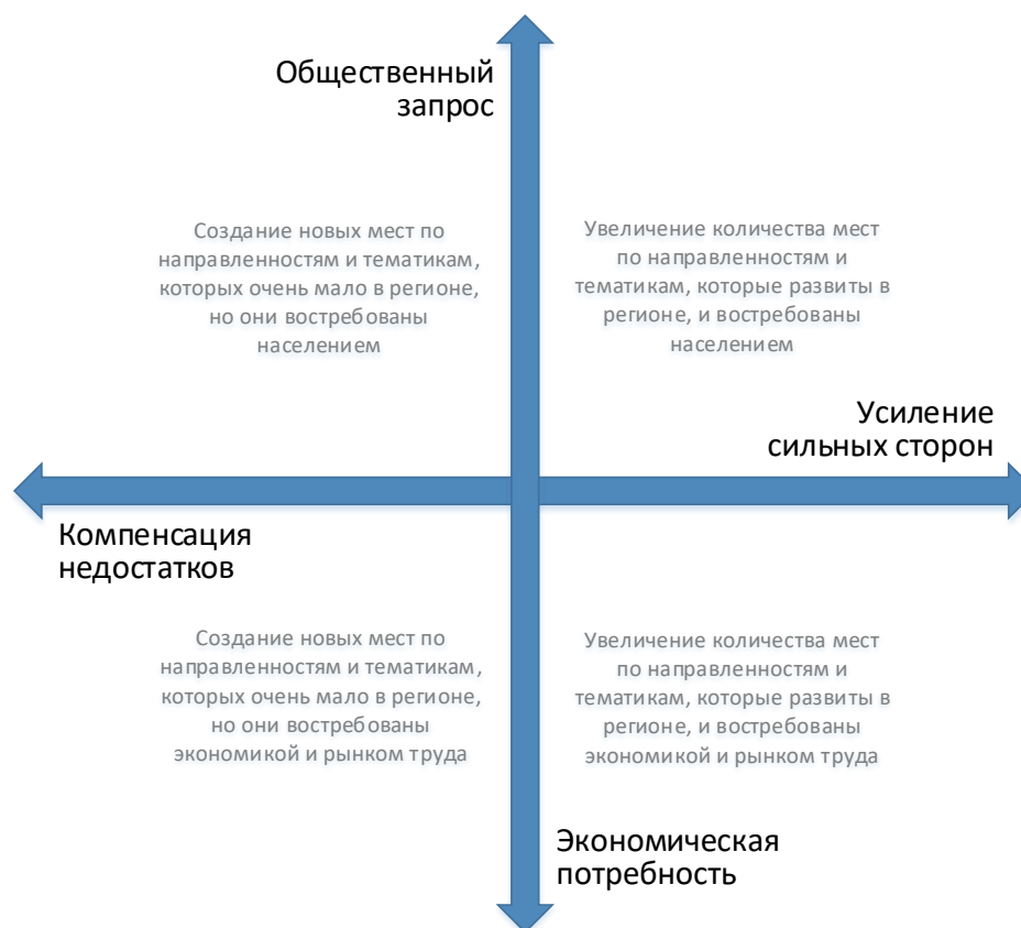
Рис. 2. Шкалы выбора тематики и тактики создания новых мест дополнительного образования