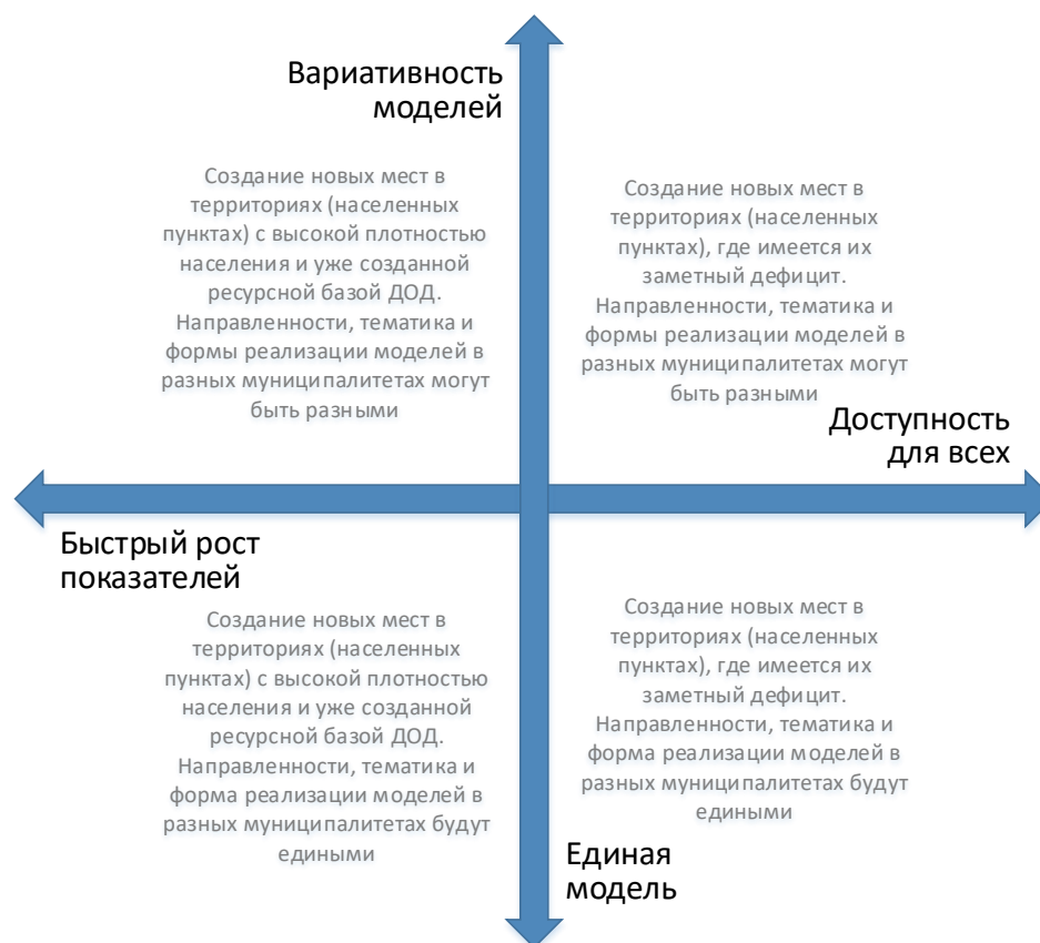
Рис. 4. Шкалы выбора модели создания новых мест с учетом актуальной управленческой политики