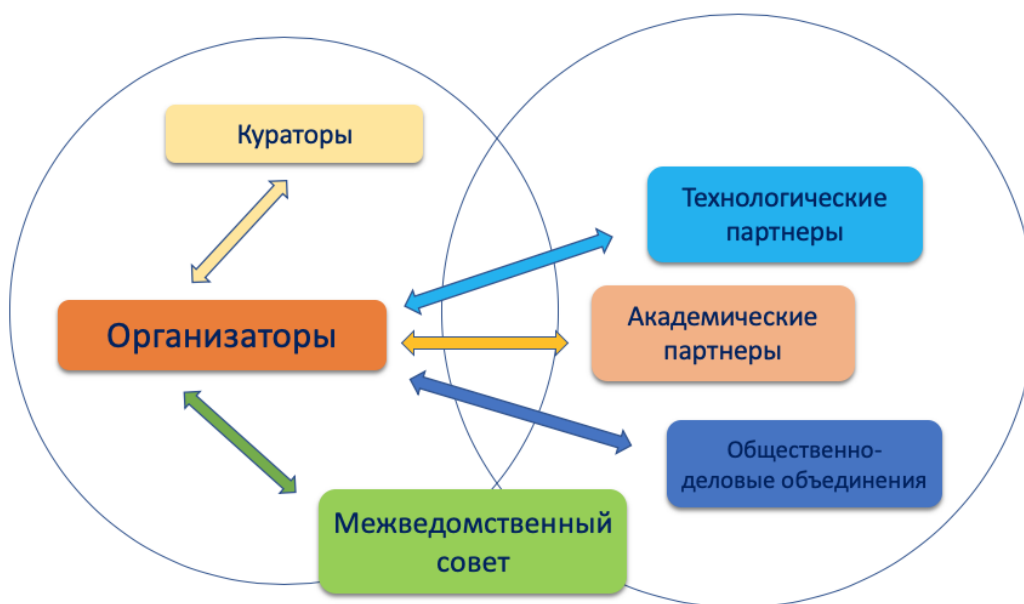
Рис. 1. Схема взаимодействия участников мероприятий по внедрению и функционированию типовой модели «Спортика»

Схема взаимодействия участников мероприятий по внедрению и функционированию типовой модели «Спортика» приведена на рис. 1.