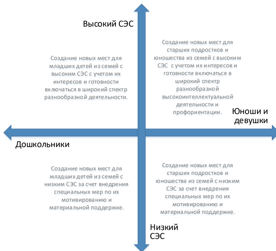
Рис. 5. Шкалы выбора модели создания новых мест по программам физкультурно-спортивной направленности с учетом особенностей контингента обучающихся

Вовлечение в программы детей из семей с низким образовательным и культурным уровнем потребует осуществления определенных PR-шагов, поиска мотиваторов для данных детей, в том числе материальных.