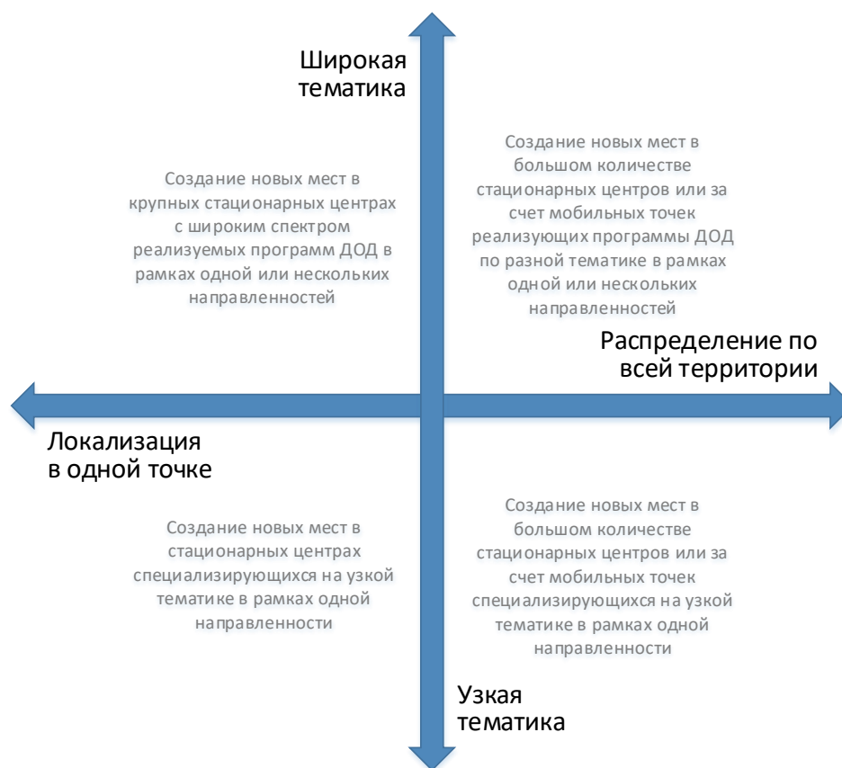
Рис. 3. Шкалы выбора масштаба и формы реализации новых мест по программам ДОД

При невыполнении хотя бы одного из них возникает необходимость пространственного распределения реализуемой модели через мобильные или сетевые решения.