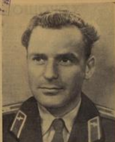
Космонавт ЦК ВЛКСМ Герман Степанович Титов работает в башке ракеты ЦК ВЛКСМ и готовится к полету (слева) к работе в космосе. Справа — командир Спутника Восток-2 Владимир Комаров

№ 41 (4888) * Пятница, 6 августа 1961 г. * Цена 1 коп.